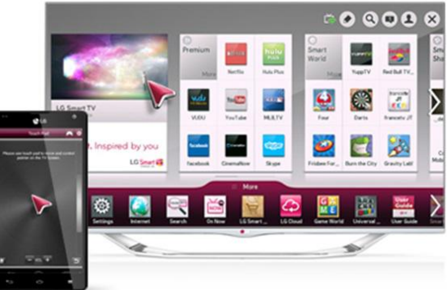
نرم افزار Remote TV LG:

این نرم افزار به منظور کنترل تلویزیون از روی گوشی موبایل و یا تبلت برنامه نویسی و آماده شده است.